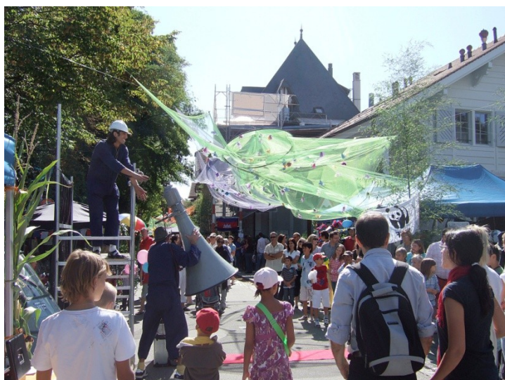
Les Tréteaux 2009

Pour la suite, nous mettrons systématiquement en ligne, sur notre site :